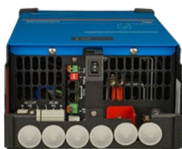
MultiPlus 2000 VA (sin la cubierta inferior)