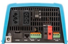
MultiPlus 500 / 800 / 1200 / 1600 VA