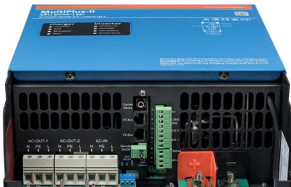
Área de conexión

Mide la tensión y temperatura de la batería y permite el seguimiento y control mediante smartphone u otro dispositivo bluetooth.