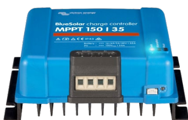
Controlador de carga solar MPPT 150/35